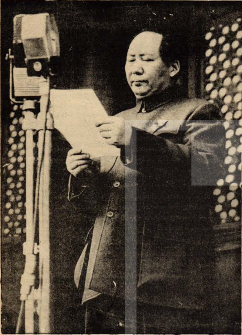
Çin Ayağa Kalkıyor. Başkan Mao Zedung 1 Ekim 1949'da Tien An Men Meydanında ÇHC'nin Kuruluşunu İlan Ediyor

1 Ekim 1976 Çin Halk Cumhuriyeti'nin kuruluşunun 27. yıldönümüdür. 27 yıl önce 1 Ekim günü, Başkan Mao Zedung Pekin'de Tien An Men meydanına kırmızı bayrağı çekmiş ve yeni Çin'in ayağa kalkışını tüm dünyaya ilan etmişti. Çin halkı, Çin Halk Cumhuriyeti'nin kuruluşunun 27. yılında, ülkesinin kurucusu ve önderi Mao Zedung'u kaybetmenin derin acısı içindedir. Dış ve iç düşmanlarına karşı mücadelede ve proletarya diktatörlüğünü güçlendirmede Çin halkı, acısını kuvvete dönüştürerek yeni bir kararlılıkla ileri atılmaktadır.