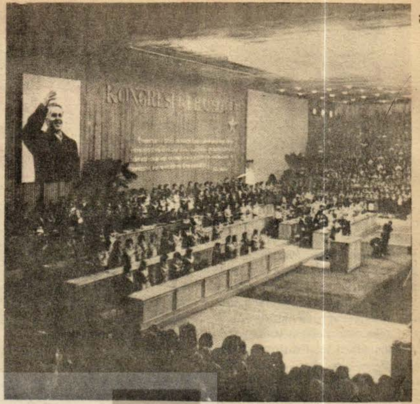
AEP 6. Kongresi Revizyonizme ve Maceracılığa Karşı Mücadele Çağrısı Olmuştur

Tören hep birlikte söylenen Enternasyonal ile son buldu.