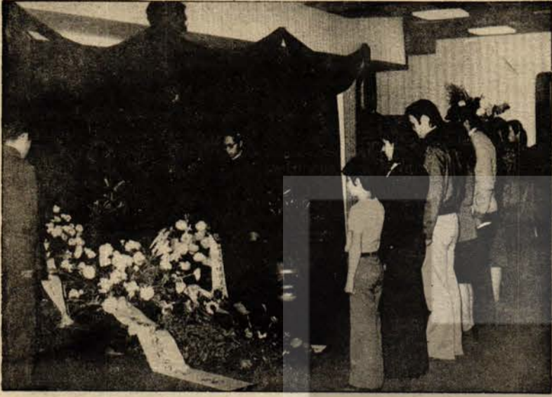
Bonn'daki Çin Halk Cumhuriyeti Büyükelçiliği'ni ziyaret ederek saygı duruşunda bulunan Türkiyeli devrimciler heyeti.

18 Eylül Cumartesi günü Yıldız Gazetesinin çağrısıyla Köln şehrinde dünya proletaryasının ve ezilen halkların büyük öğretmeni Mao Zedung'un ölümü dolayısıyla bir anma töreni düzenlendi. Törene Batı Avrupa'nın çeşitli ülkelerindeki şehirlerden 70'e yakın devrimci, işçi ve öğrenci katıldı. Ayrıca törende kalabalık olarak Yunanlı devrimciler, KPD/ML (Almanya Komünist Partisi/Marksist-Leninist) ve KPD'nin (Almanya Komünist Partisi) temsilcileriyle İran Öğrenci Derneği temsilcileri de hazır bulundular.